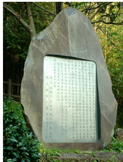
平成元年創立80周年にあたり、磨崖碑全文を新しい石に刻み後世に残すことにした