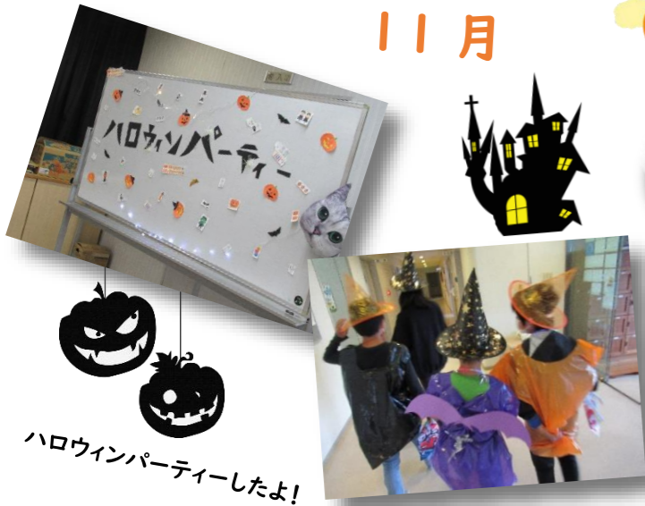
ハロウィンパーティーしたよ!