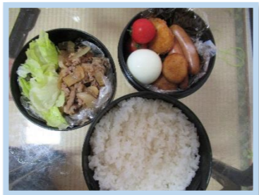
とても上手にできていますね！