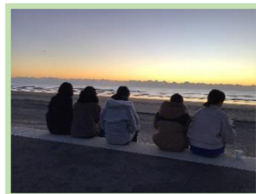
みんなで日の出を観賞