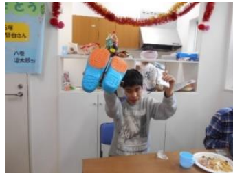
うみユニット 卒業を祝う会