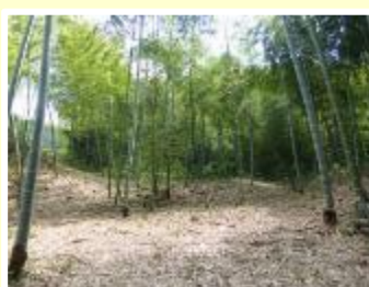
<ボランティア活動後>