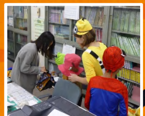
低年2寮 ハロウィン