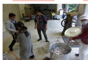
炊き出し訓練 (左: 児童寮 右: 成人寮)