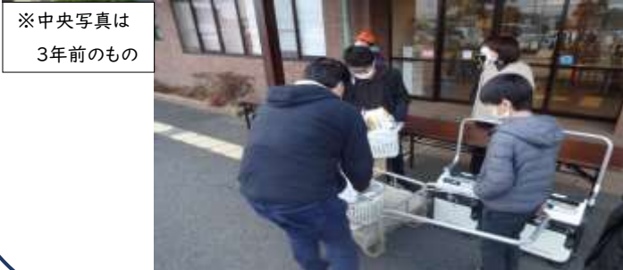
※中央写真は 3年前のもの